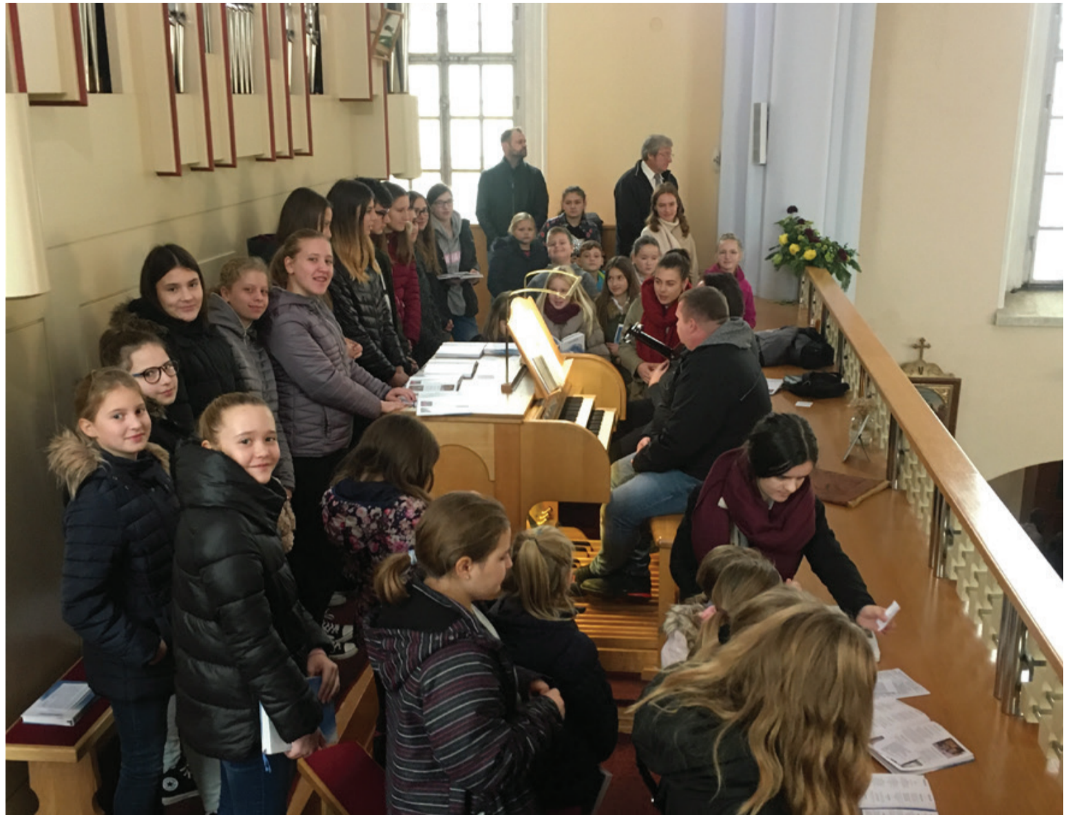
Zbrani mladi pevci na markovskem koru