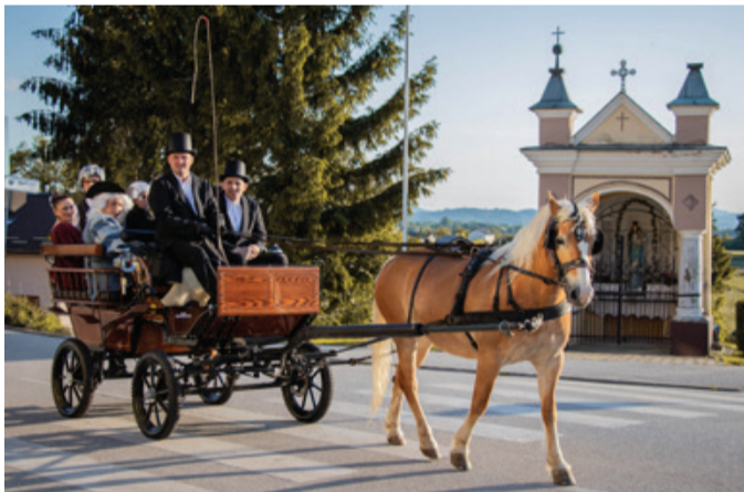
Konjeniško društvo je s konjsko vprego predstavi dalo piko na i.