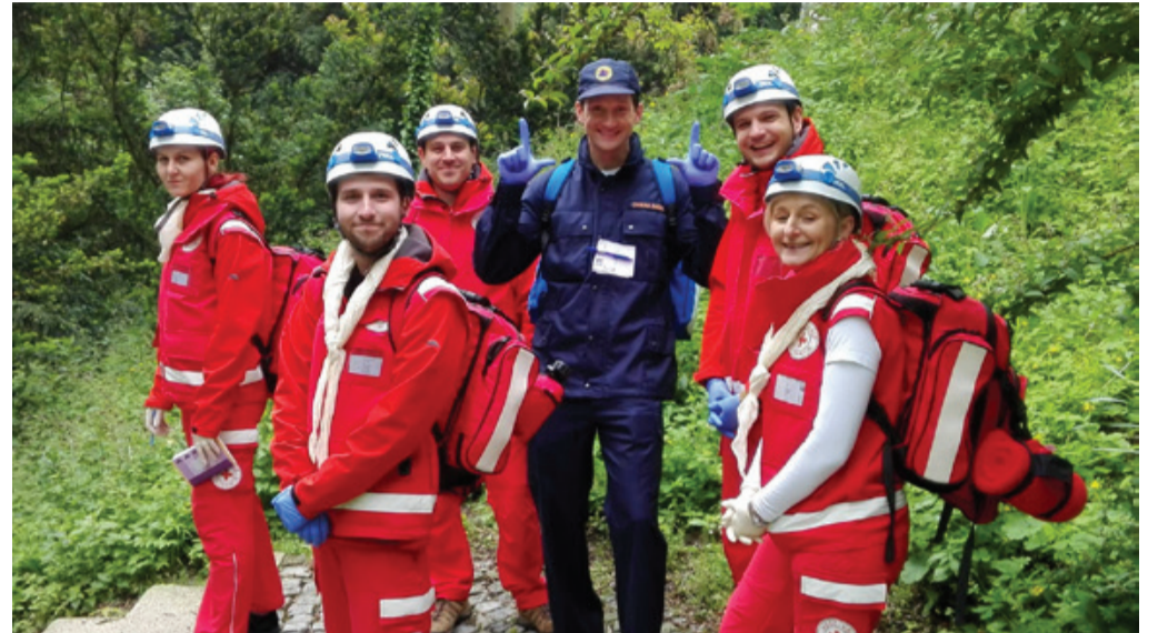
Ekipa prve pomoči je bila dobro razpoložena

Rdeči križ Slovenije, Območno združenje Ormož, občina Ormož in Uprava Republike Slovenije za zaščito in reševanje – Izpostava Ptuj so v soboto, 18. maja, izvedli 24. regijsko preverjanje usposobljenosti ekip prve pomoči Civilne zaščite in Rdečega križa v Podravju.