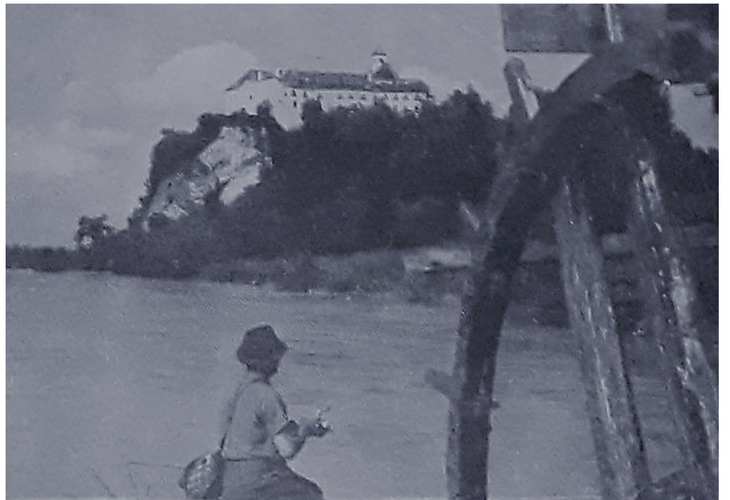
Vernikov mlin v Stojncih. Slika je najverjetneje nastala med obema svetovnima vojnoma. Določeni deli mlina so bili odprodani v mlin Korošec.