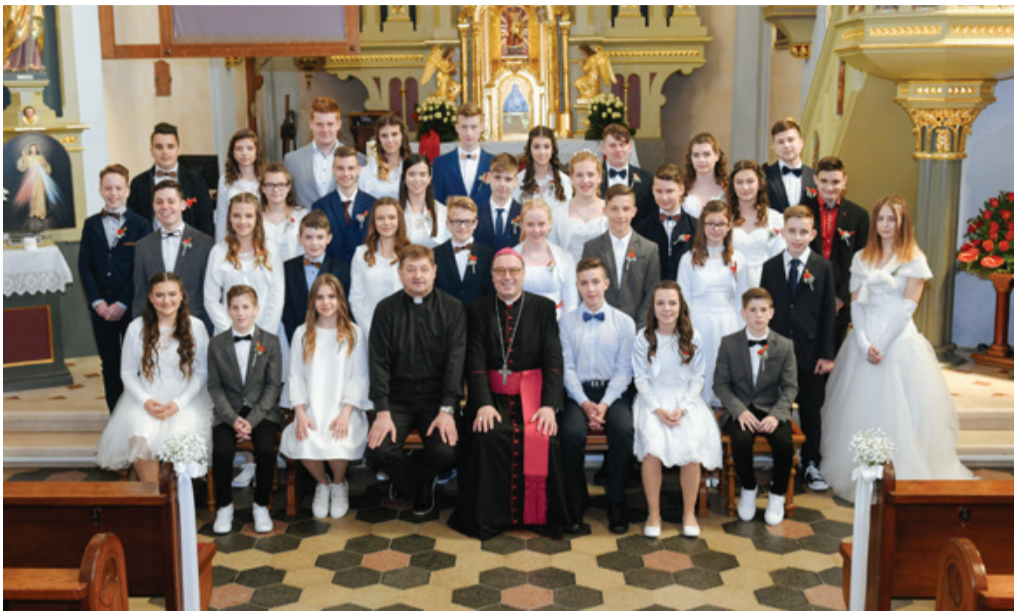
Birmanci 8. razredov in ...

Po velikonočnih slovesnostih in obhajanju Markove nedelje je bil mesec maj za našo župnijo duhovno zelo bogat, saj je 68 mladih prejelo zakrament sv. birme, 47 zakrament prvega svetega obhajila, 19 zakonskih parov pa je obhajalo svoje obletnice poroke. S pripravniki na prejem zakramenta sv. birme se pripravljamo dve leti. Uvod v pripravo na birmo je bilo srečanje pripravnikov iz vse škofije v Mariboru, ki se ga je udeležilo več kot 1000 mladih. Zadnje leto smo v pripravo vključili tudi animatorke, ki so se s pripravniki na birmo po skupinah srečevale ob sobotah. Ta srečanja so bila velika obogatitev za oboje.