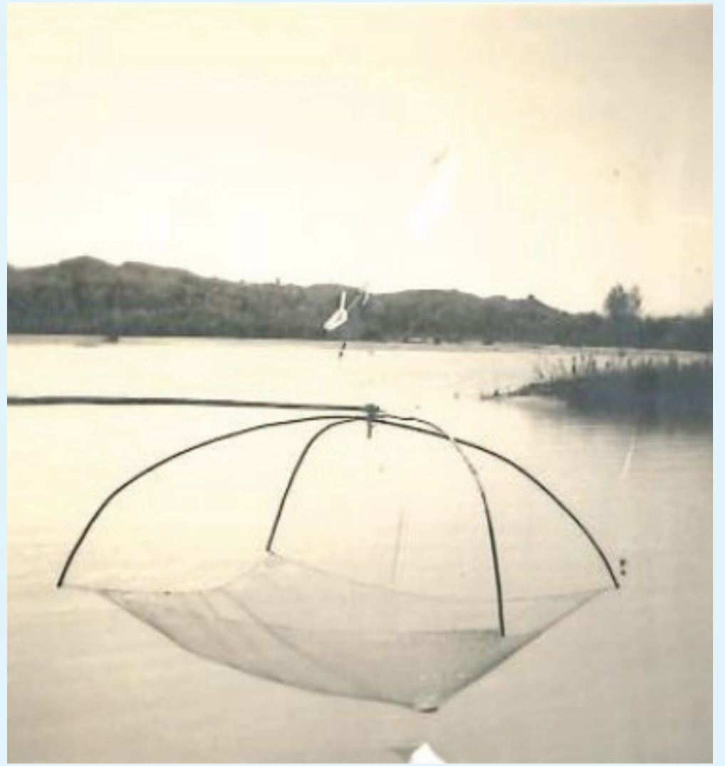
Mreža (šero) od blizu. Mreža se je potopila v vodo. Riba, ki je priplavala nad njo, se je pri dvigu mreže iz vode ujela. Za ribolov so potrebni nenehni dvigi in spusti mreže v oziroma iz vode, kar je precej bolj utrudljivo od klasičnega ribolova, ulov pa je bil neprimerno večji.

(Privzeto po Ptujskem listu, politično gospodarski tednik; Ptuj, 20. julija 1919)