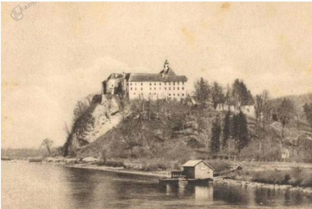
Cvetkov mlin

Mlinarstvo spada med najstarejše obrti človeškega rodu. To je bila sprva dodatna aktivnost h kmetijski dejavnosti, šele kasneje se je razvilo v obrtništvo. Prevažanje žita in mlevskih izdelkov na daljavo je bilo nekoč praktično nemogoče, predvsem pa zamudno in drago. Umestitev mlinov v agrarno okolje je bila torej nuja. Naša občina je močno povezana z reko Dravo, reko, ki je prinesla veliko veselja (ribolov, kopanje, pogoni za žage in mline ...), pa tudi gorja (povodnji, utopitve). V začetku so izkoriščali različne vire pogonov mlevskih kamnov, od živine (voli), do vodnih virov, moči vetra. Šele kasneje so za pogon uporabili sprva paro in nato tudi elektriko. Gostota mlinov na reki Dravi je bila med obema svetovnima vojnama 2,2 mlina na kilometer reke Drave. Vsi mlini so bili že takrat vpisani v register. Po tem registru je zagotovo obstajal še vsaj en mlin na relaciji Zabovci-Stojnci, o katerem v tem zapisu ne bo govora.