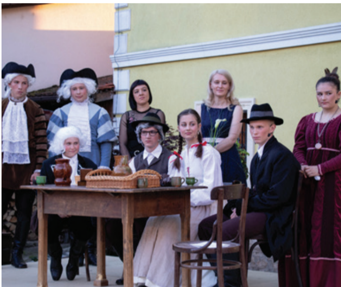
Igralska zasedba z režiserko in kostumografkinjo.