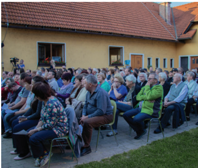
Polno župnijsko dvorišče.