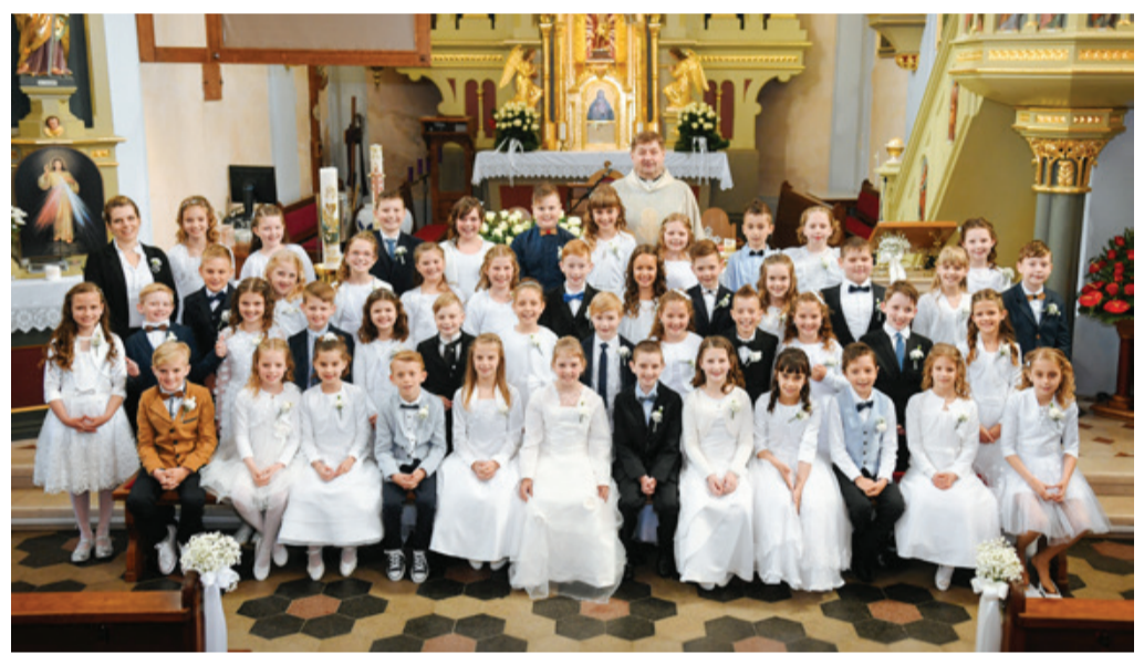
Letošnji prvoobhajanci (3. razred)