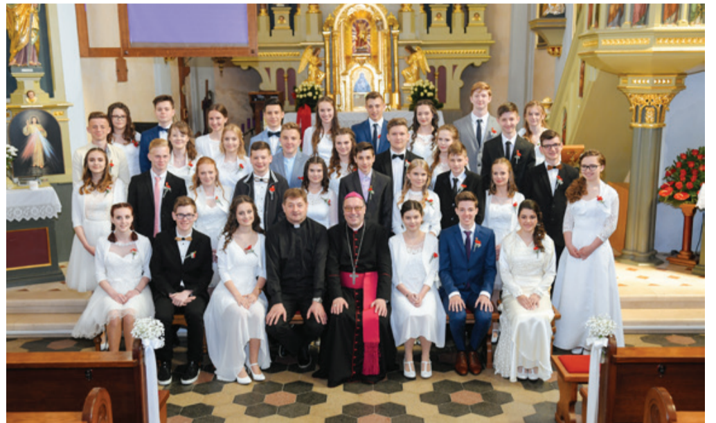
... 9. razredov

V nedeljo, 7. julija, bomo v naši župniji imeli čast prisostvovati ponovitvi nove maše, ki jo bo daroval novomašnik